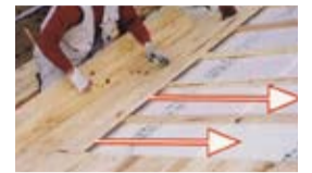
屋根(断熱通気工法) 屋根は野地板貼りの施工。湿気に強い無垢の杉板を使用しています。