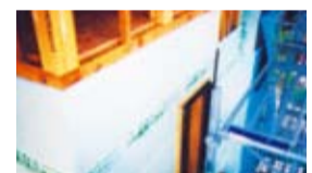
断熱パネル 断熱 気密 防水 防湿 4つの機能を備えた特許断熱パネルを採用。ジョイントは断熱材同士のつなぎ目のテープが無く結露の心配がありません。