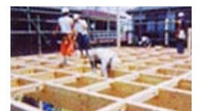
耐震工法 1階・2階とも三尺間隔に土台や梁を組み、剛床組を採用。