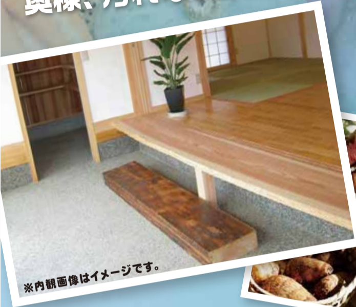
※内観画像はイメージです。