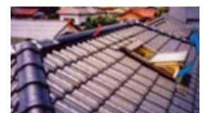
棟排気口・トップ排気口 様々な電動機能を搭載し、網戸も標準装備。快適な室内空間を演出します。